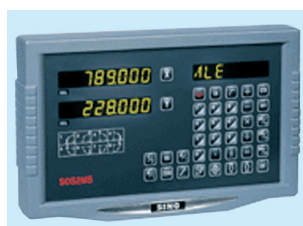
Visualizzatore di quote a tre assi di serie