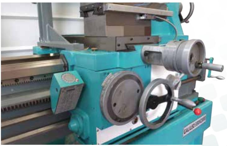
Torretta a cambio rapido modello italiano