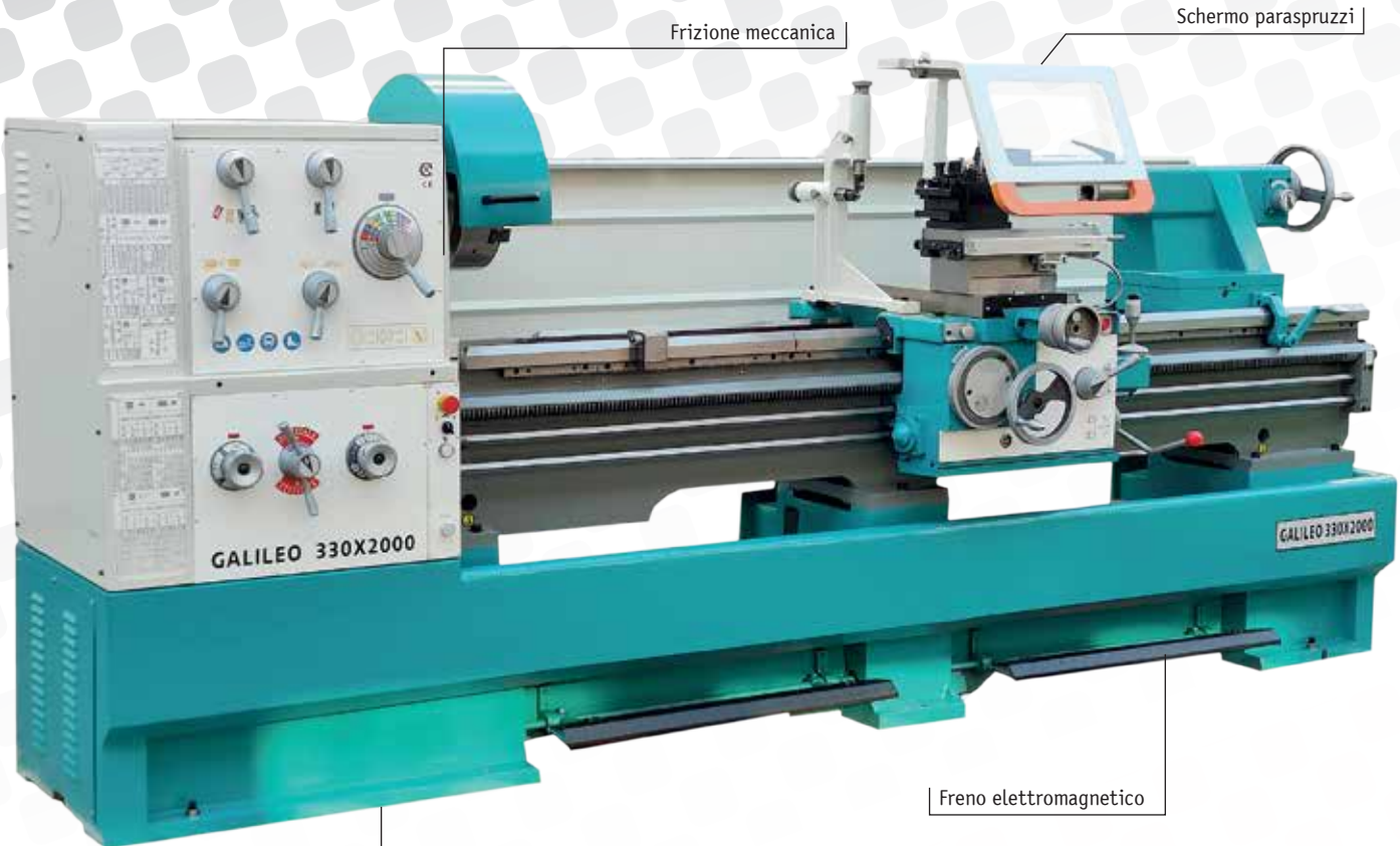
Torretta a cambio rapido modello italiano